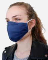
Masque chirurgical « alternatif » Ouvry